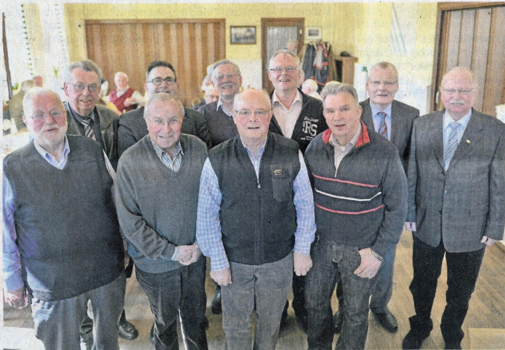
Der neu gewählte Vorstand des MGV Concordia.